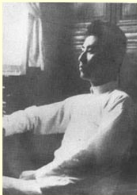
1925年初夏，在上海闸 北香山路仁余里28号家里