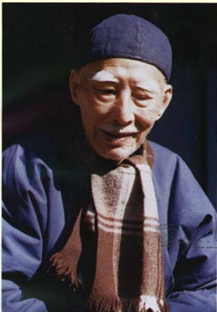
生前最后拍摄的一张照片 (1988)