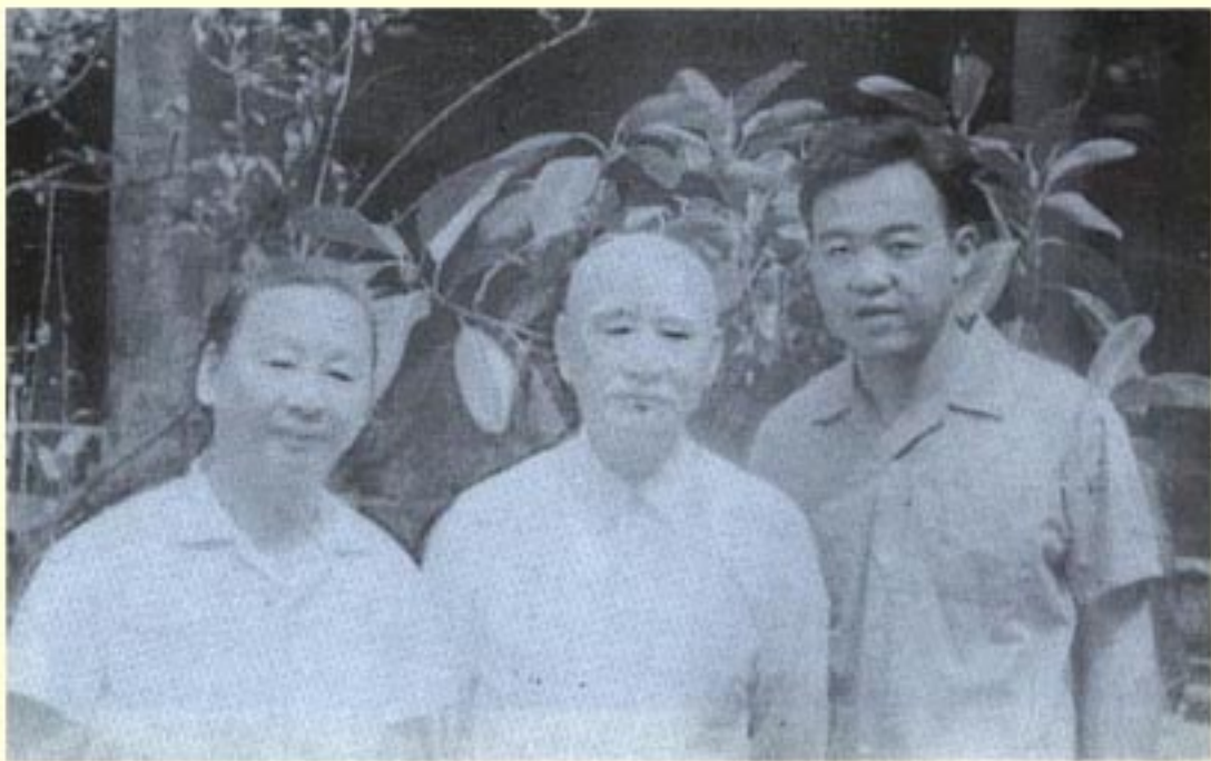
七十年代中，与女至美、孙永和