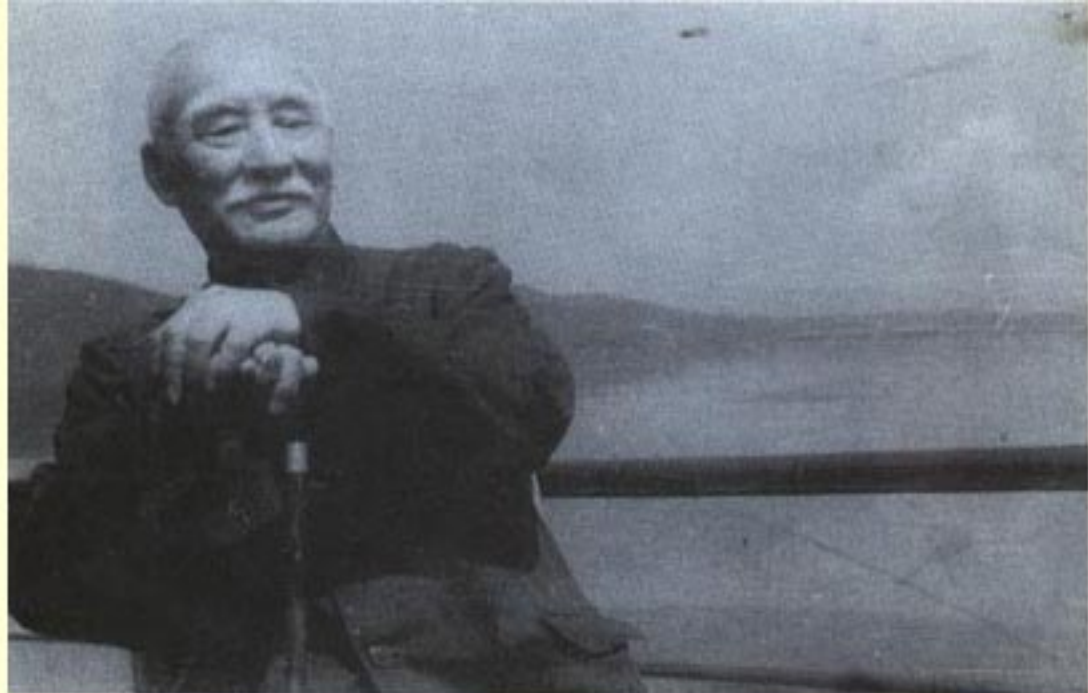
1973年6月6日，乘船游新安江水库时